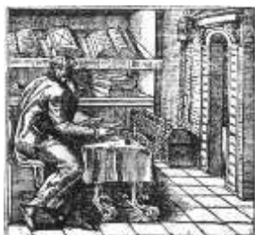
Studium et vita

Gli studenti possono avvalersi della Biblioteca diocesana "P. Bertolla" del Seminario Arcivescovile di Udine, attigua alla sede dell'ISSR Santi Ermagora e Fortunato .